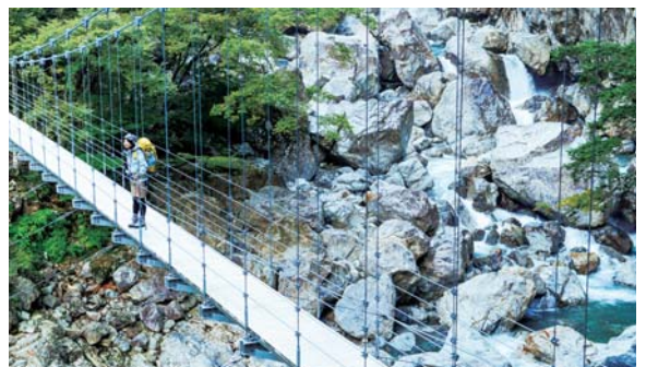
2 深い谷を見下ろしながら渡る平等岳吊橋