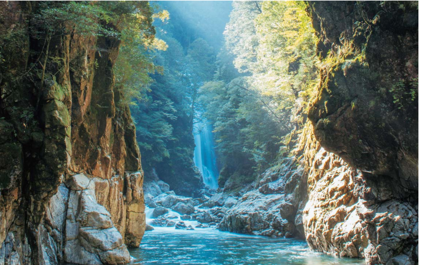
1 淵の水が美しく、静寂で神秘的なシシ淵（猪ヶ淵）

大杉谷登山道は、この雄大な峡谷を眺めながら7つの滝を間近に11本の吊り橋を越えて行き、原生林の森を抜け大台ヶ原に至る登山道です。