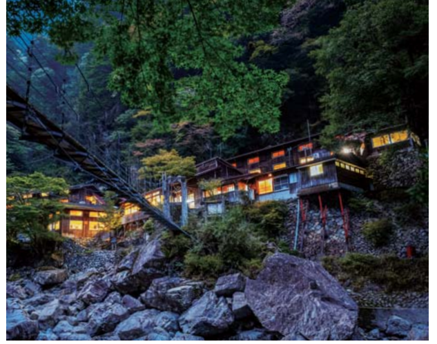
5 関西最大級の山小屋桃の木山の家