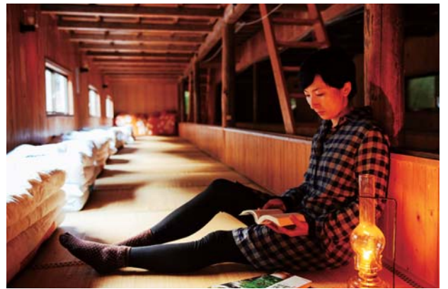
6 ゆっくりとした時間が流れる 山小屋の就寝スペース