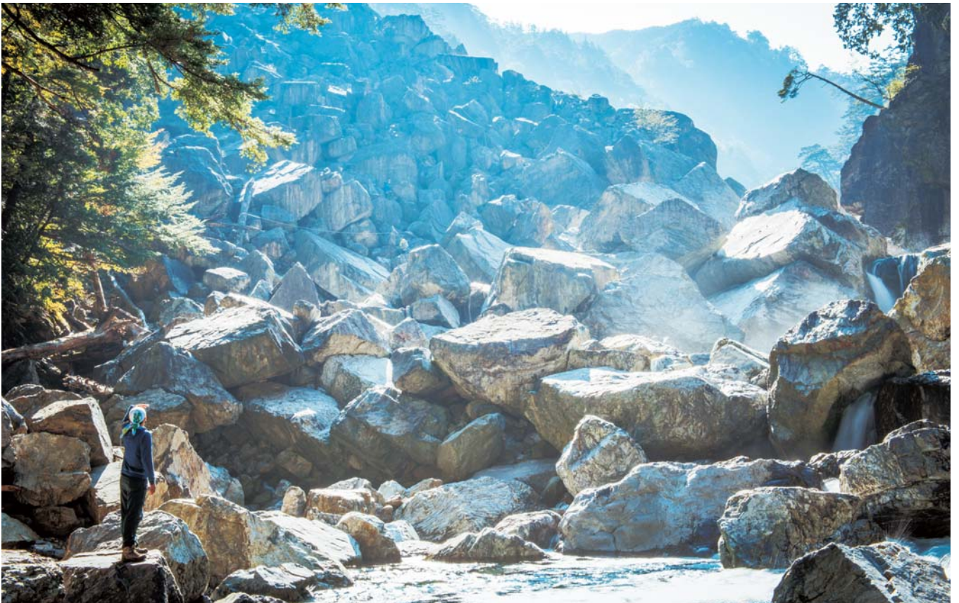
7 巨大な岩のような大崩落現場