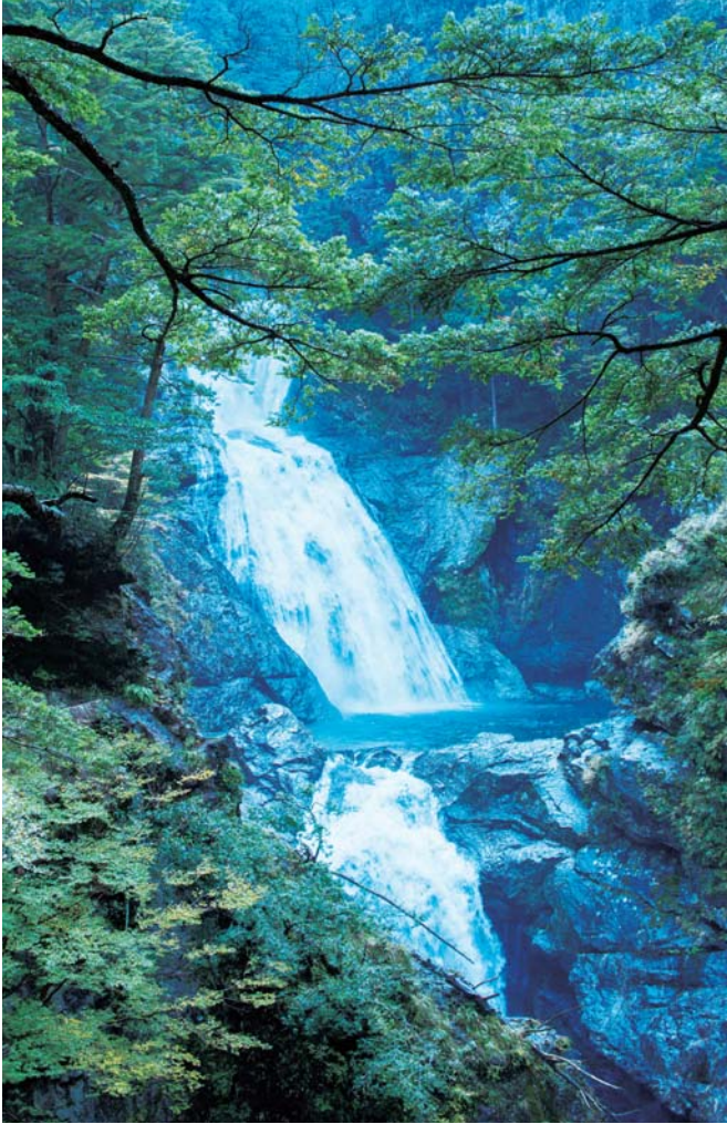
4 日本の滝 100 選にも選ばれる七つ釜滝