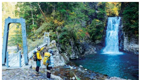
3 水量豊かで巨大な滝壺がある堂倉滝