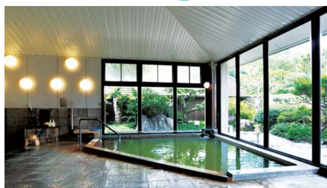
15 奥伊勢フォレストピア 温泉施設