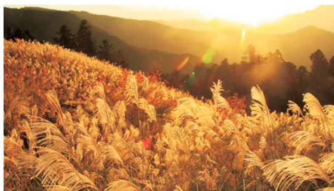
夕日に照らされるススキ