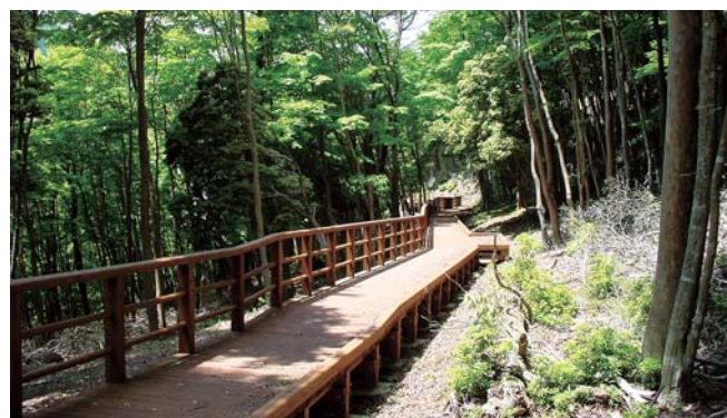
14 車いすの方でも安心の木製歩道