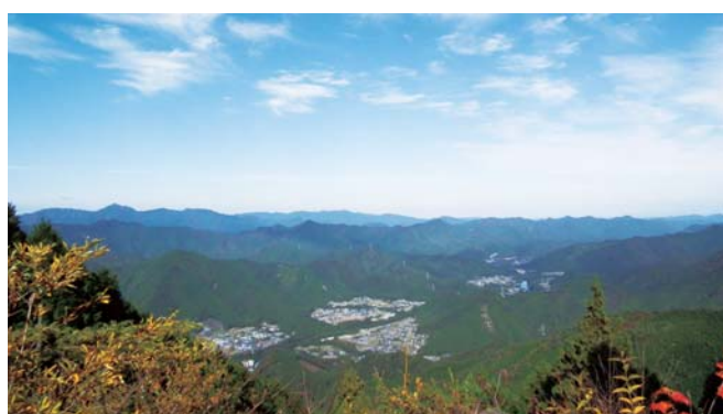
13 北総門から一望する大台町