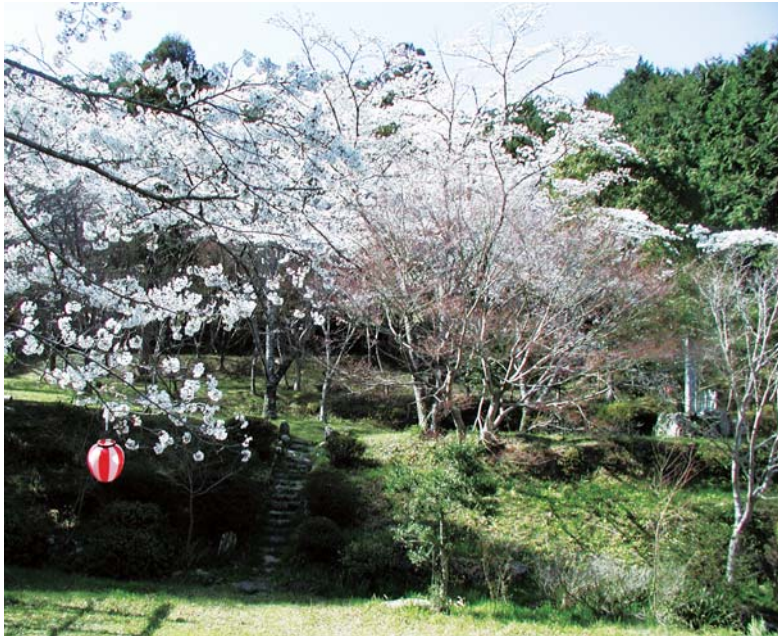
17 山と川に囲まれた天然の要害 三瀬館跡（具教館跡）

のどかな散策道を歩きながら具教の足跡をたどることで、彼が愛した風を感じてみませんか？