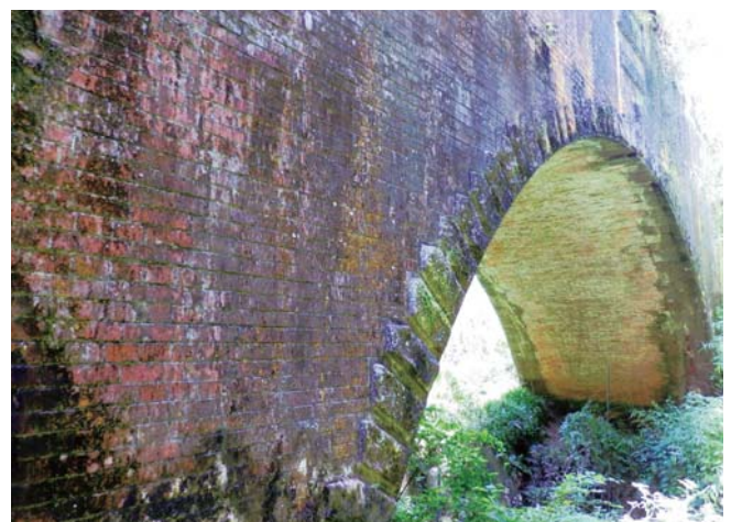
20 レンガ造りの神瀬橋（めがね橋）