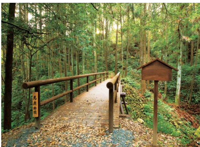
19 「伊勢路」きっての難所 馬鹿曲がり